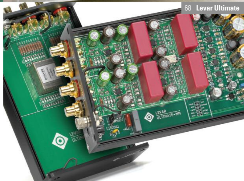
68 Levar Ultimate 76 Rike Audio