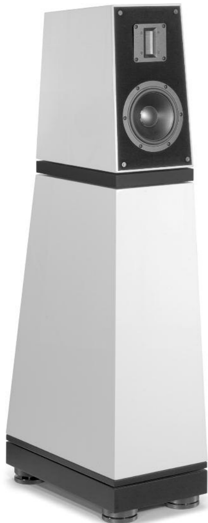
42 Verity Audio 100 B.audio