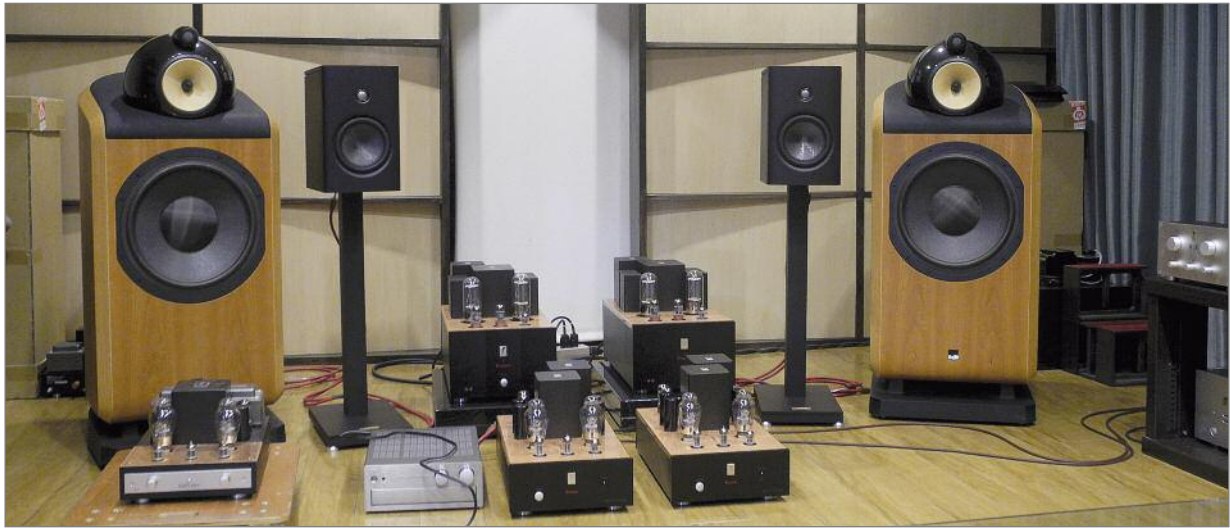
Im Audio Note Hörraum: In der Mitte die neuen Gakuoh II Endstufen, dahinter das große Erfolgsmodell Kagura, dazu als Härtestest die leistungshungrigen B&W 802 D2 und Magico Q1

nicht so einfach. Bei Audio Note gibt es zwar die sonst durchaus üblichen abendlichen Überstunden nicht, das würde man bei diesen hohen Anforderungen wohl auch nicht dauerhaft bei gleichbleibender Qualität durchhalten. Dafür dauert das tägliche Pendeln aus der Peripherie stundenlang, will