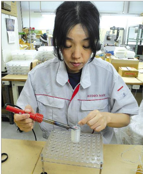
Fast fertig: Nach der Wicklung und Ummantelung der Silber-Kondensatoren werden die Silber-Anschlussdrähte angelötet