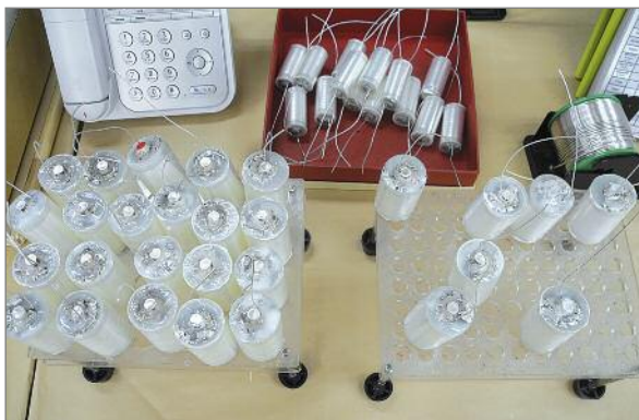
Im letzten Arbeitsschritt erhalten die Anschlussseiten der Silber-Kondensatoren einen sichernden und dauerhaft dichten Abschluss aus Epoxydharz

füllt mit Dämpfungsmaterial. Klanglich entscheidend soll dabei die Art der Keramik sein.