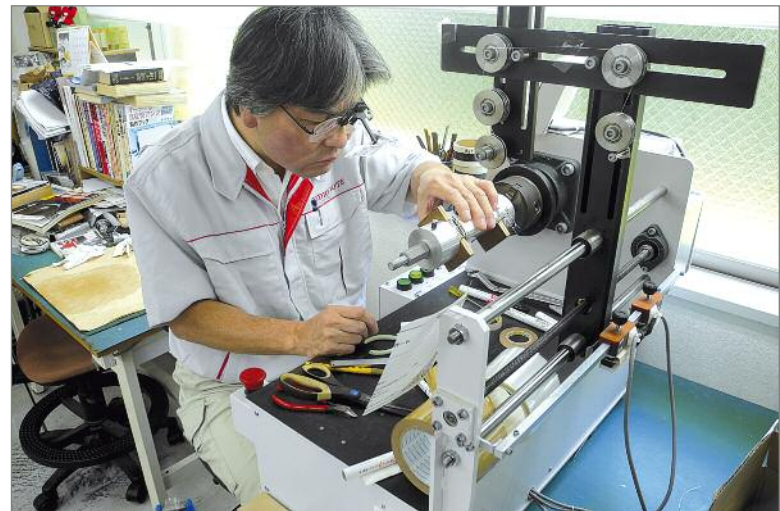
Hoch konzentriert: Hier werden gerade die Ausgangsübertrager für die neue Gakuoh II Endstufe gewickelt, immer zwei symmetrierte Paare pro Seite