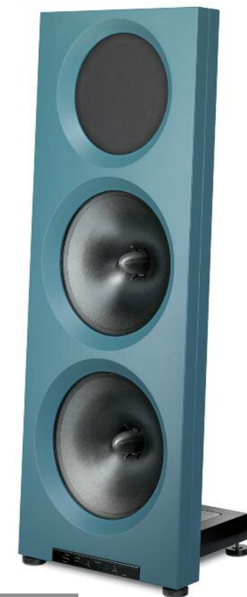
98 Spatial Europe