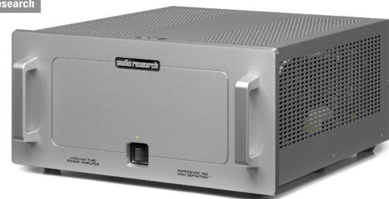
50 Audio Research