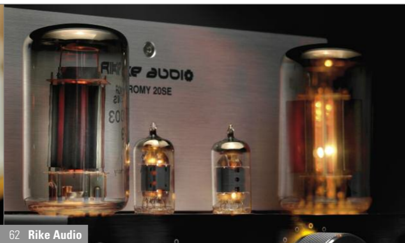
62 Rike Audio