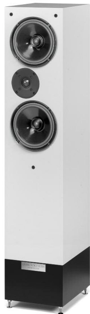
110 Living Voice