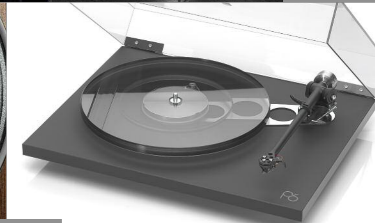
114 Mach One 66 Rega