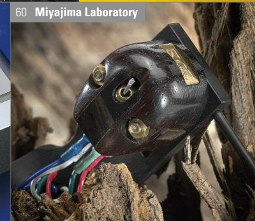
60 Miyajima Laboratory