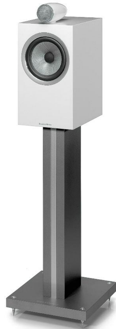
92 Bowers & Wilkins