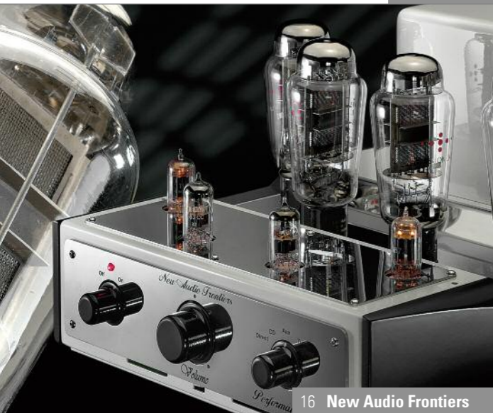
16 New Audio Frontiers