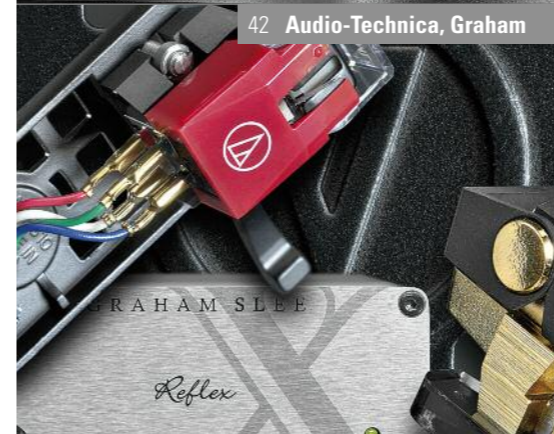
42 Audio-Technica, Graham