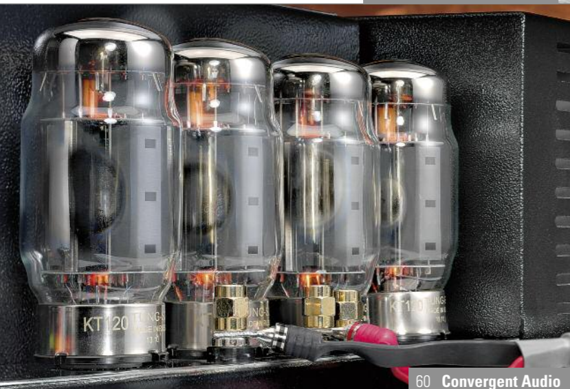
60 Convergent Audio 22 Dereneville