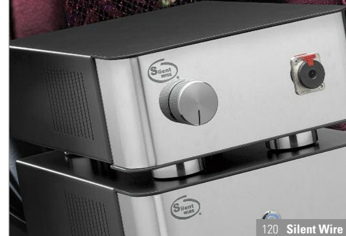
120 Silent Wire 14 Air Tight