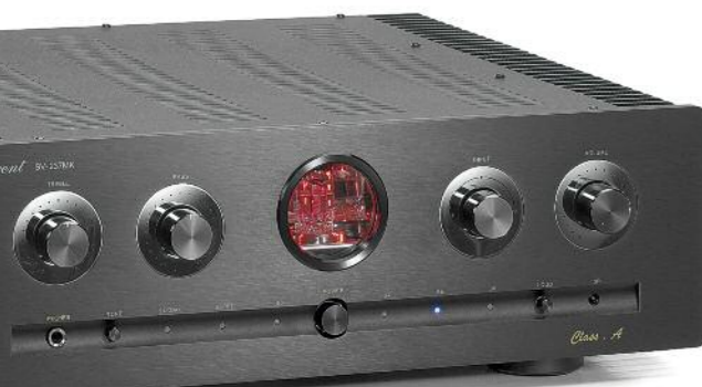
50 Vincent 36 Octave