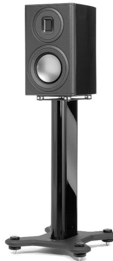
84 Monitor Audio