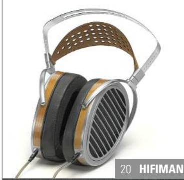
20 HIFIMAN 128 Report