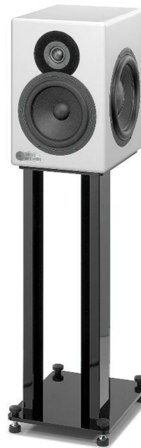
92 Audio Optimum 58 Musical Fidelity