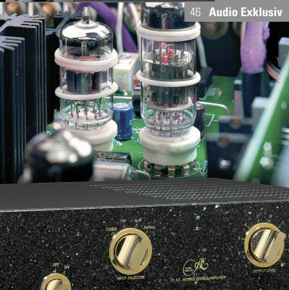
46 Audio Exklusiv