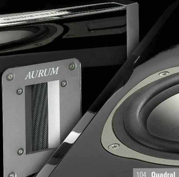
104 Quadral 70 Genuin